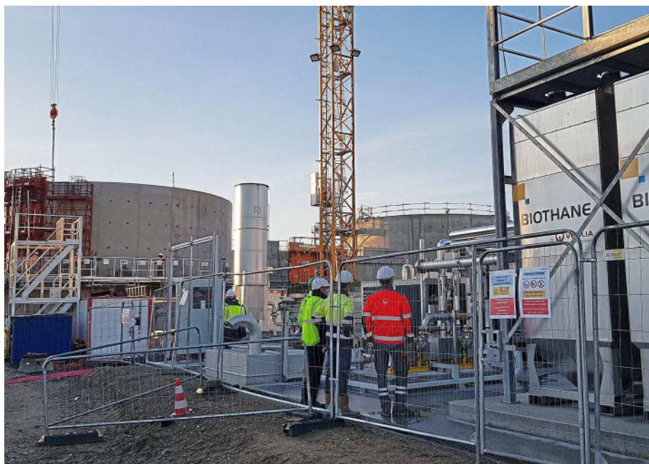
Bonneuil-en-France, vendredi. La source d'énergie produite représente 13 GWh/an, soit la consommation annuelle de plus de 2 600 logements neufs chauffés au gaz.

Depuis novembre, la station d'épuration injecte du biogaz issu de la fermentation des déchets organiques dans le réseau public.