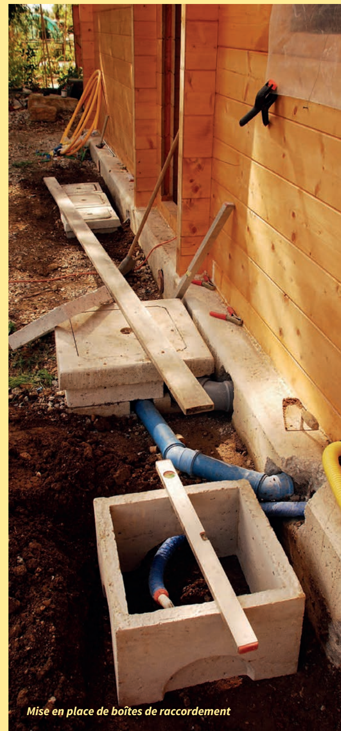
Mise en place de boîtes de raccordement

Les joints seront étanches. Les tuyaux seront en grès ou en fonte. Le diamètre du branchement devra être inférieur ou égal au diamètre de la canalisation publique. Pour la desserte d'un seul logement, il ne sera pas inférieur à 150 mm, pour la partie sous le domaine public.