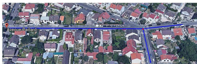
Localisation des travaux Avenues Paillard et Bocquet

Enfin, l'accès au parking située Place du 8 Mai 1945 sera maintenu par une circulation alternée du 08/08 au 15/08. Lors du chantier, il vous sera demandé de stationner dans les rues ouvertes à la circulation.