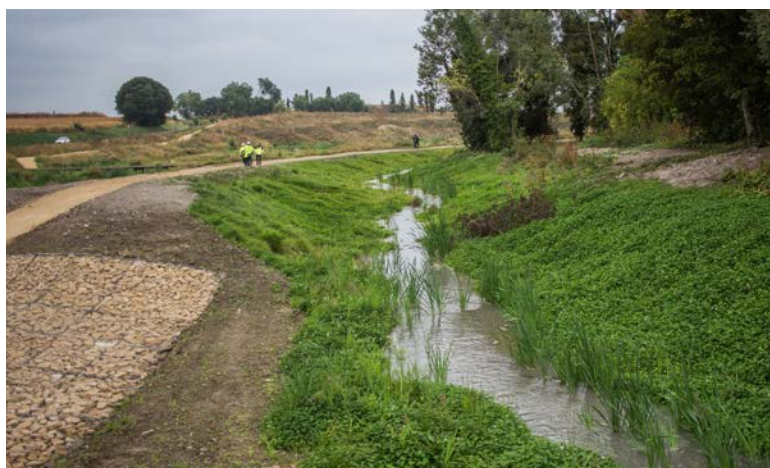
▼ Le Croult, quelques instants après sa mise en eau.