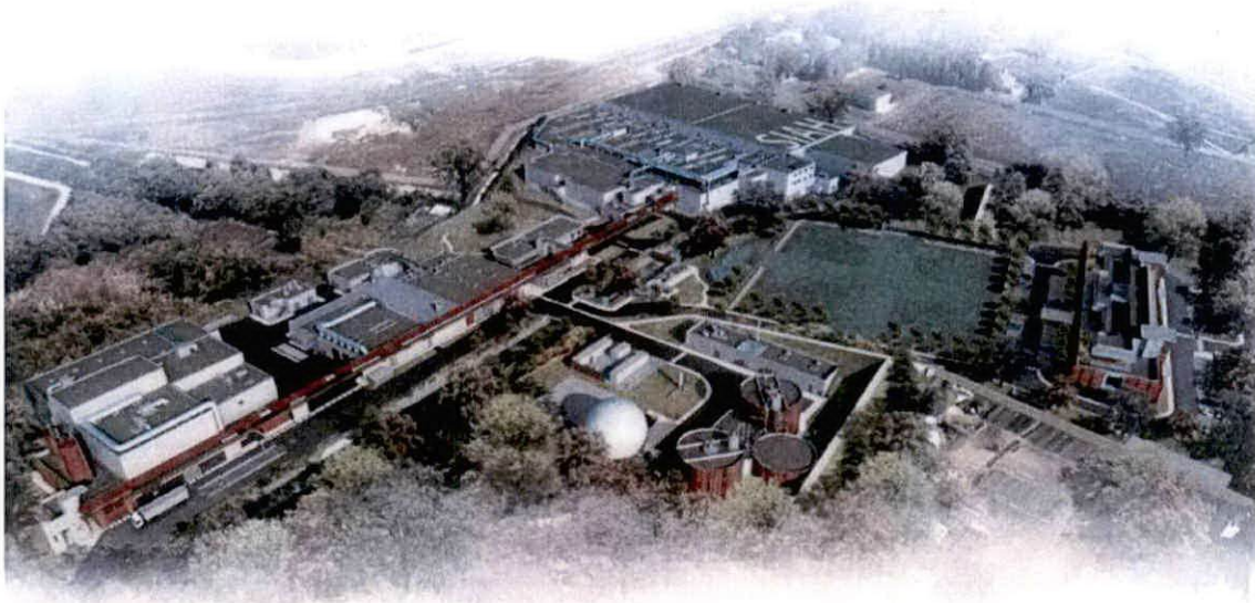
Figure 1 : Projet de la station

Dans le cadre de l'extension de la station de dépollution de BONNEUIL-EN-FRANCE, deux scénarios ont été étudiés concernant le rejet des eaux usées traitées.