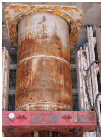
↑ Vue plongeante sur le puits et sur le micro-tunnelier. Le micro tunnelier se place dans un puits qui a été préalablement creusé sur plusieurs mètres. La machine est placée face à une des parois du puits, puis avance doucement grâce à une poussée hydraulique.

Il est en effet prévu de remplacer et d'élargir le pont (2 en réalité) de la gare. Dans le cadre de ce chantier, la ville de Louvres a demandé au SIAH de déplacer les réseaux de canalisations d'eaux usées et d'eaux pluviales qui étaient situés sous la chaussée existante.