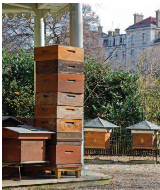
↑ Ruches situées dans un parc de Paris