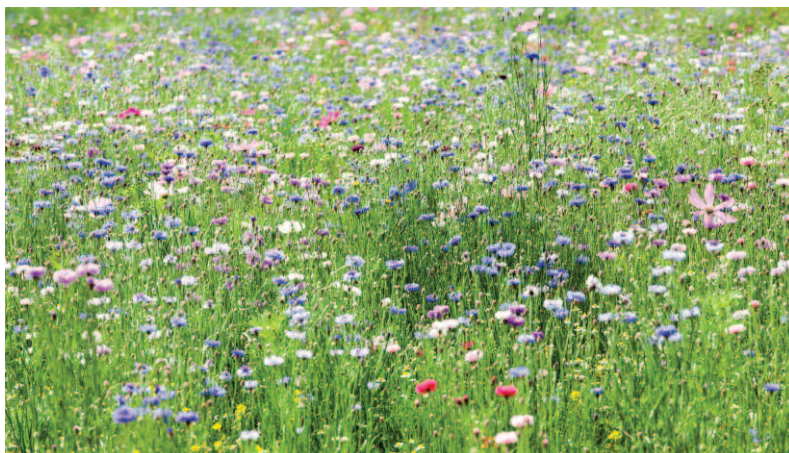
↑ Cas de fauche tardive : certaines personnes pensent que ces sites ne sont pas entretenus n'ayant pas l'aspect rectiligne des jardins à la Française