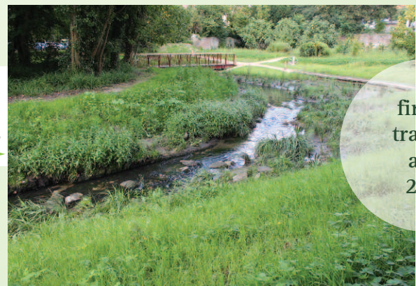
● point de vue final du méandre et de la zone humide avec les végétaux