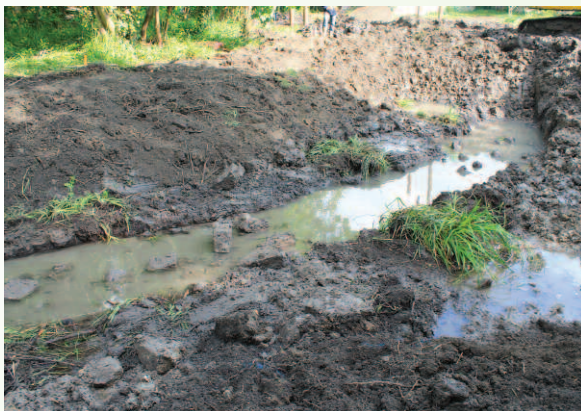
● creusement du lit