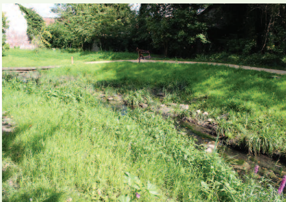
● le méandre avec la pousse des végétaux