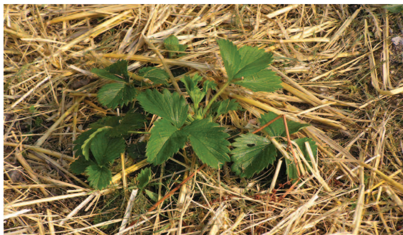
Exemple de paillage ↑

Les personnes étant en charge de la gestion des espaces verts, peuvent classer ces espaces selon divers critères tels que leur emplacement (en milieu urbain, en périphérie de la ville, entre deux espaces agricoles, etc.), leur super-