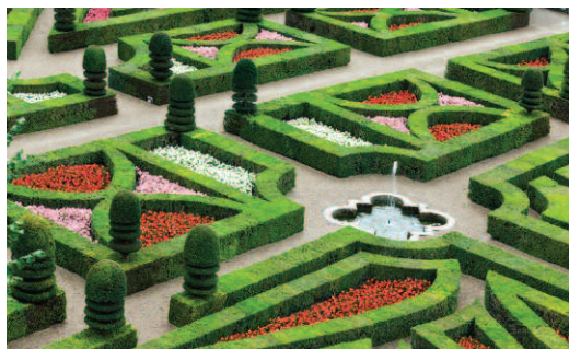
Exemple de jardin à la Française

Le cas des abeilles illustre parfaitement cela. La population des abeilles diminue fortement, année après année, de façon générale dans les campagnes où l'usage systématique des pesticides est important (agriculture, entretien des voiries, jardiniers amateurs, etc.). La baisse