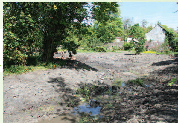
● méandre sous un autre point de vue